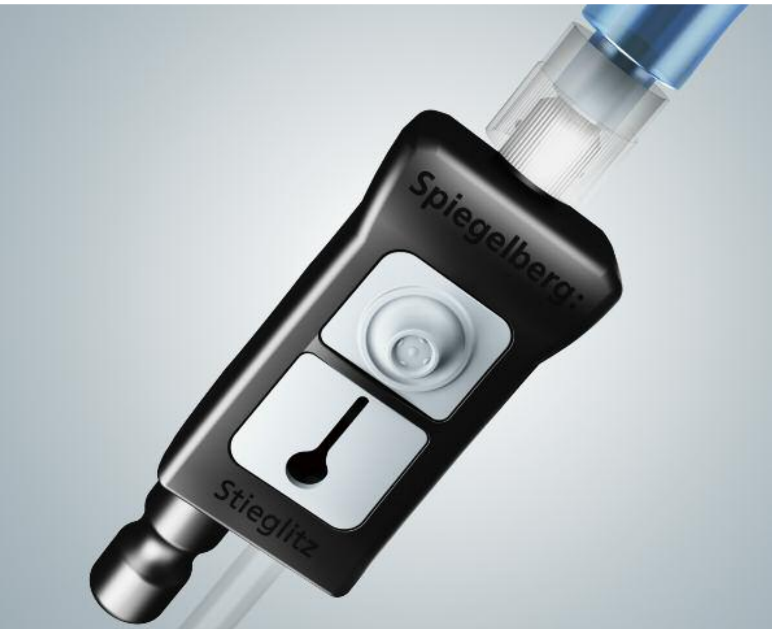
Stieglitz | Spülsauger